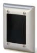
HD500 – Beröringsfri läsare i vandalsäkert utförande. Tålig för slag och flamsäker.

■ Med Handsfree-läsare kan dörren öppnas på upp till 1 meters håll. Denna lösning är perfekt i miljöer, som ett lager eller sjukhus, där personalen ofta har händerna upptagna med att bära eller skjuta saker framför sig.