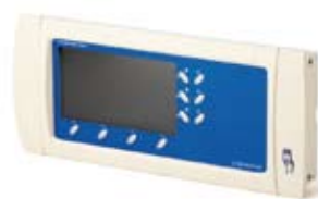
IP811 Infopoint. Bokningsterminal för bl a tvättstugebokning.