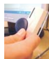
USB-RIF – Interface-box med kortläsare för inläsning av kort, snabbsökning och inloggning i systemet