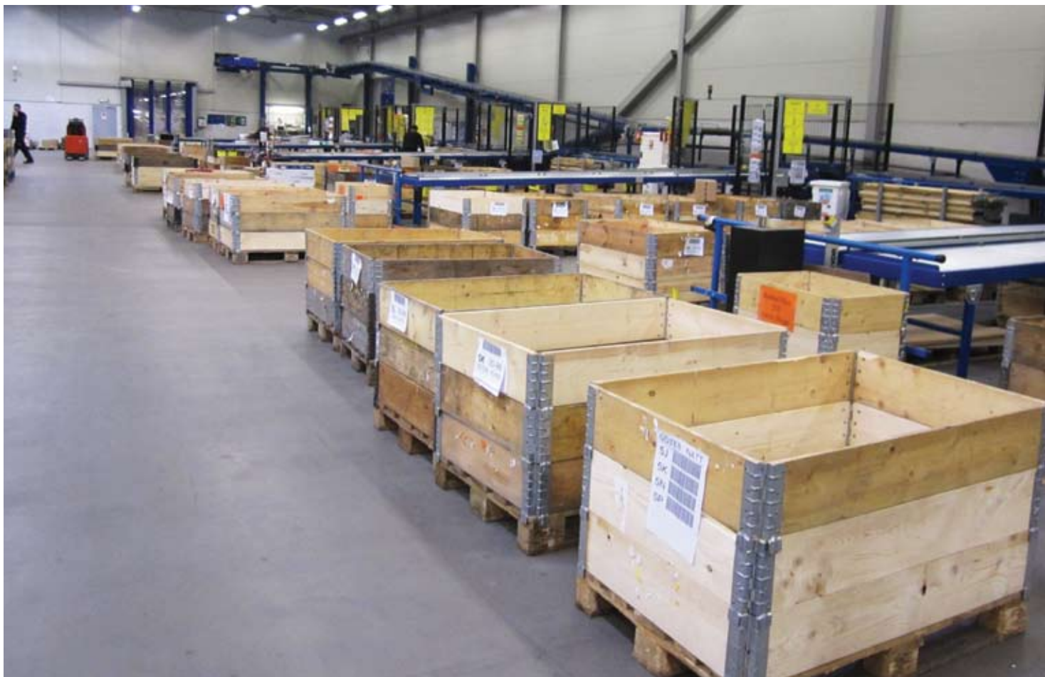
Här sorteras godset för leverans.

Många produkter hamnar i blåa backar som styrs av robotkranar. Runt lokalen åker de blå backarna till olika stationer, antingen för lagerhållning eller till plockstationerna för packning. Totalt finns fyra robot-rader med backar som innehåller produkter från olika leverantörer, sorterat i två eller fyra fack.