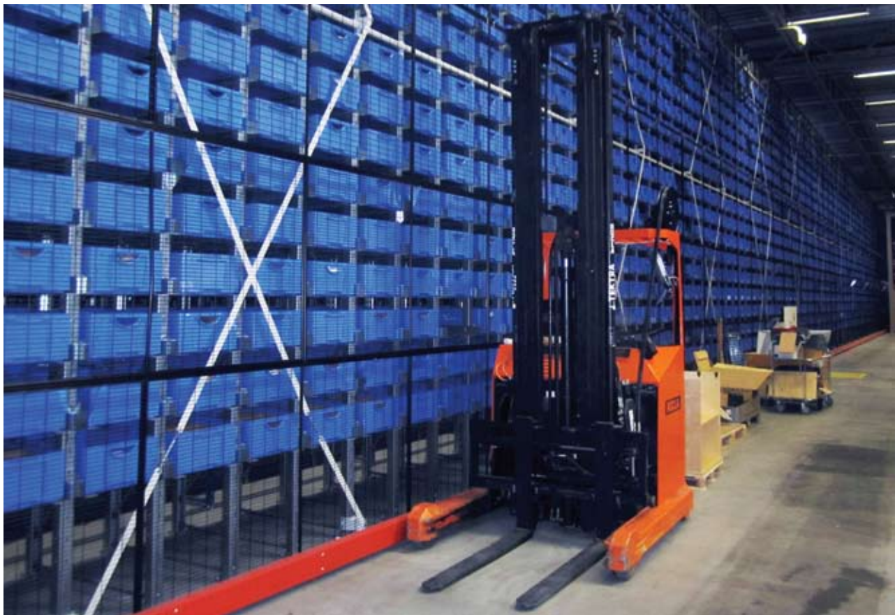
Blå backar på rad i Halmstad.