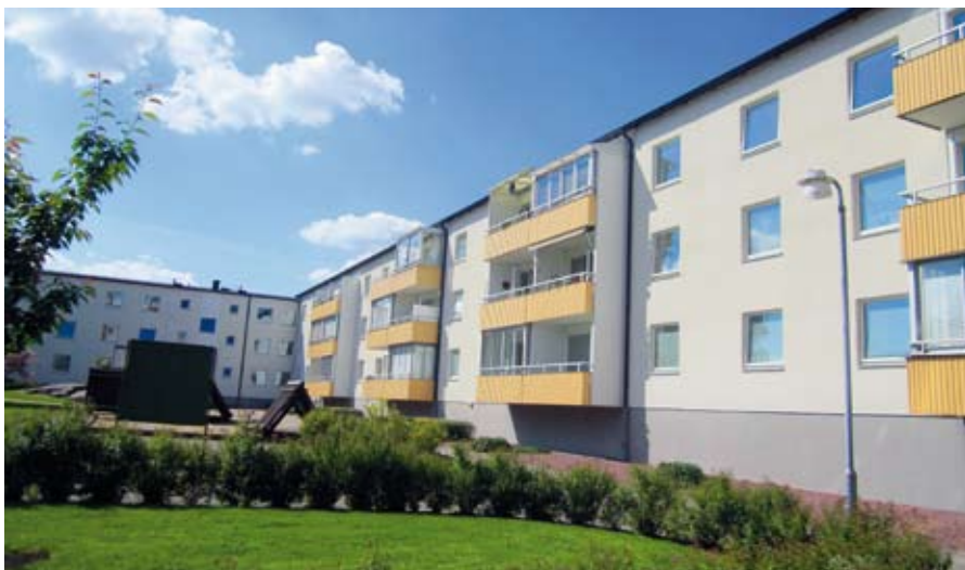
Bostadsrättsföreningen Bokeberg är ett av Hässleholms Låssmeds många bostadsprojekt