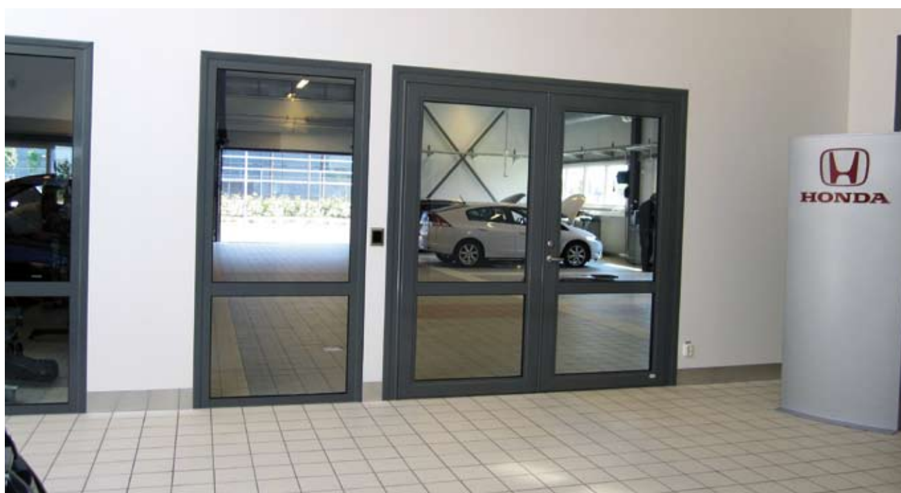
Ljust och fräsch även i verkstaden