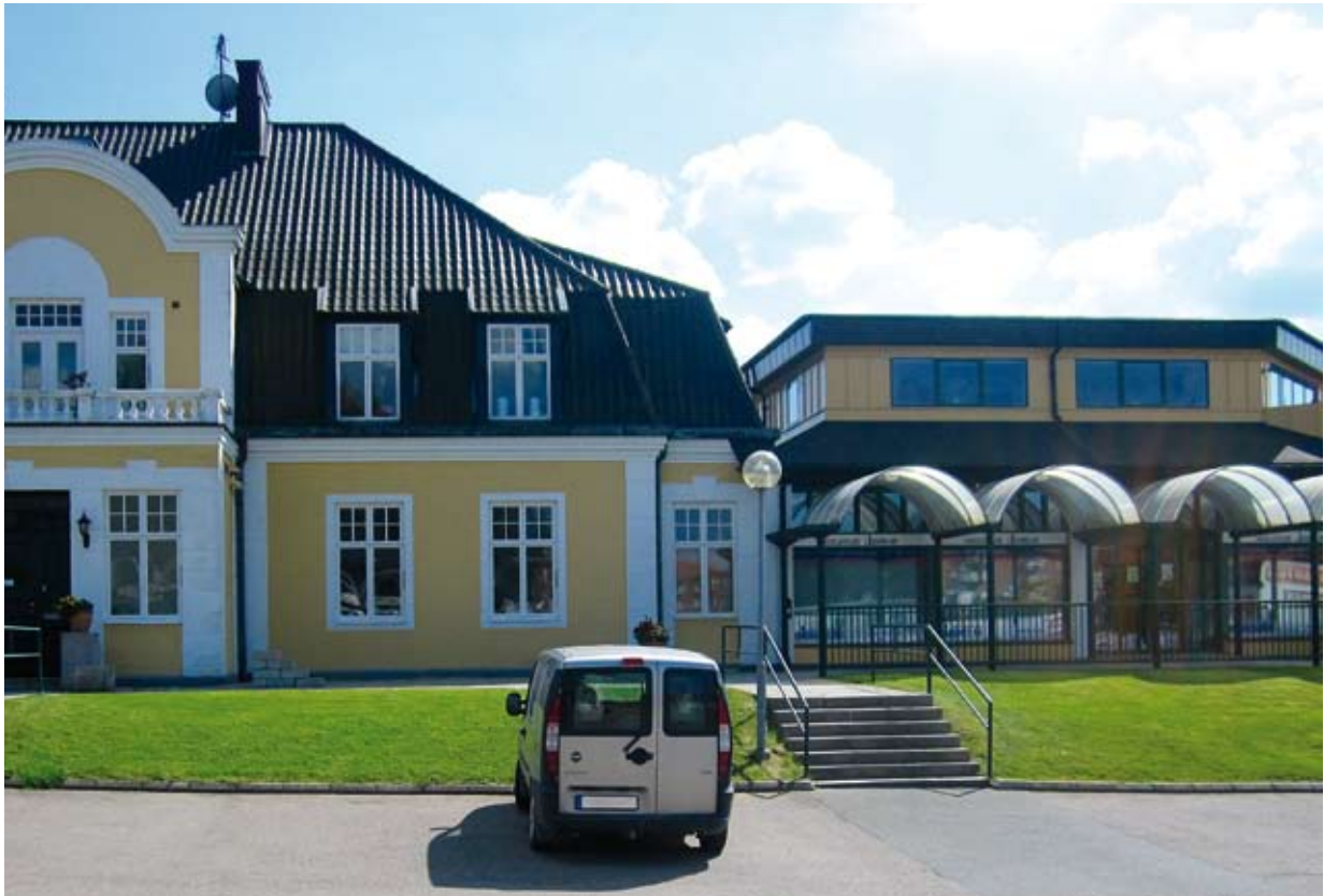
Hässleholms Låssmed AB