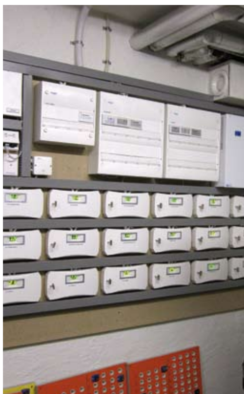
Snyggt och prydligt bland undercentralerna

Den stora förändringen är dock hur bra allt numera fungerar i tvättstugorna. Föreningen har arton tvättstugor i området som bokas via fyra boknings-tavlor. Tidigare var det vanligt att