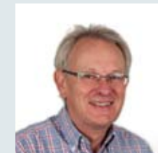
Bertil Stolt Supportområde: Porttele, Kodlås, Bewacard, Simplebus, Brand, Detektorer, CCTV, On-site