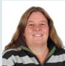
Andrea Picetti Supportområde: System 2010, SPC, Sintony 60, Detektorer