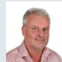
Raymond Lindberg Supportområde: System 2010, On-site, Sintony 60, Detektorer