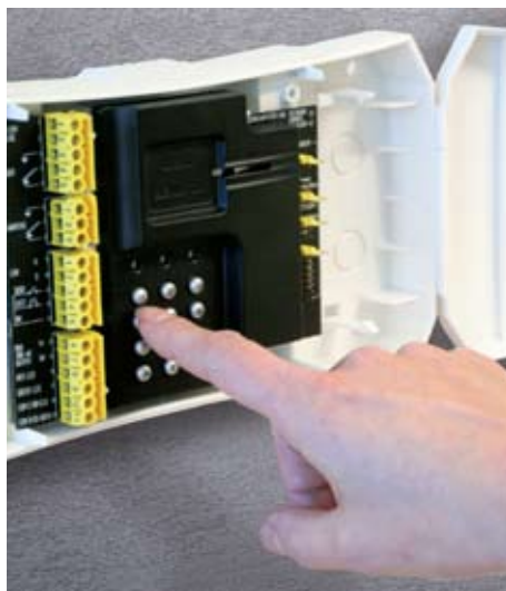
Programmering via DC800.

nikationen. Alla händelser loggas vilket ger dig möjlighet att göra uppföljningar. Att lägga in nya kort, bestämma behörigheter för personer eller spärra borttappade kort går snabbt och enkelt i den Windowsbaserade programvaran. PCn behöver inte vara permanent inkopplad utan kan kopplas in när man vill göra förändringar. Det är även lätt att göra utskriften av händelser och programmerad information från PCn.