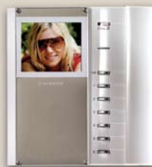
Videoapparat Bravo s/v eller färg