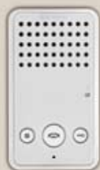
Audioapparat Easycom handsfree

Systemets flexibilitet medför att det fritt går att blanda video- och audioapparater i samma system. Det går även att parallellkoppla svarsapparater i till exempel större lägenheter eller kontor där det ska gå att svara och släppa in besökaren från mer än ett ställe. Både video- och audioapparater är utrustade med så kallad privatfunktion, vilket innebär att det går att stänga av ringsignalen under natten eller andra tider på dygnet då man inte vill bli störd. Svarsapparater finns med video i färg eller svart/vitt.