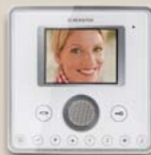
Videoapparat Planux färg handsfree