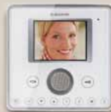
Videoapparat Planux färg handsfree