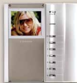
Videoapparat Bravo s/v eller färg