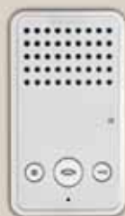
Audioapparat Easycom handsfree

Systemets flexibilitet medför att det fritt går att blanda video- och audioapparater i samma system. Det går även att parallellkoppla svarsapparater i till exempel större lägenheter eller kontor där det ska gå att svara och släppa in besökaren från mer än ett ställe. Både video- och audioapparater är utrustade med så kallad privatfunktion, vilket innebär att det går att stänga av ringsignalen under natten eller andra tider på dygnet då man inte vill bli störd. Svarsapparater finns med video i färg eller svart/vitt.