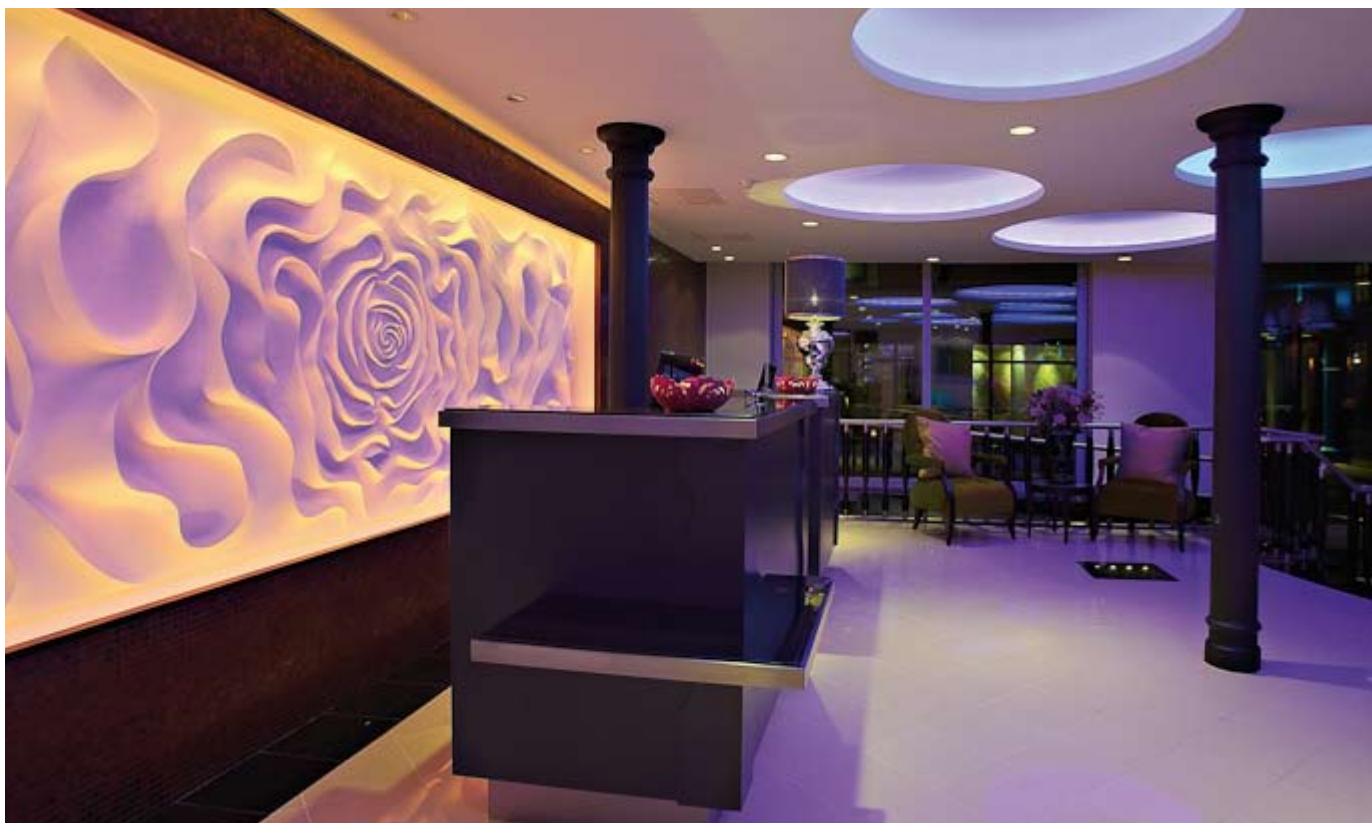
Välkomnande reception med vacker ros

GC-gruppen AB projekterade anläggningen och ansvarade för all el- och svagströmsinstallation under ombyggnaden. Det är även GC-gruppen som har ansvarat för installation av säkerhetssystemet. Administrationen av passerkorten sköts enkelt av hotellets personal. I systemet är det enkelt att tilldela behörigheter, lägga till nya kort eller ta bort kort som kommit bort.